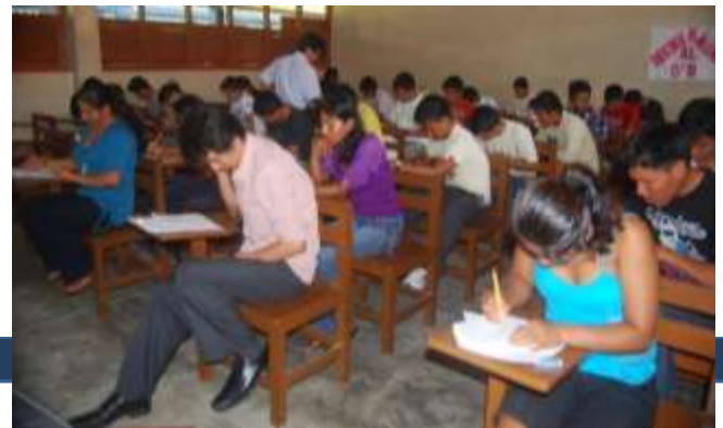
Aplicación del Examen de Admisión para el ingreso a las dos carreras profesionales.

La presencia de una sucursal del tecnológico "PADAH" en la localidad de Santa Clotilde se debe a que el 13 de diciembre del 2011 se firmó el convenio de Cooperación Interinstitucional entre la Municipalidad del Napo y el Tecnológico con la finalidad de contribuir en la formación integral de jóvenes y adultos, con competencias profesionales y técnicas de acuerdo a la demanda de la zona y contribuir así, al desarrollo sostenible.